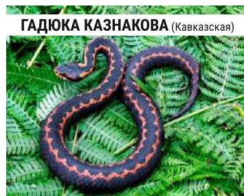
ГАДЮКА КАЗНАКОВА (Кавказская)