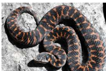
РЕЛИКТОВАЯ ГАДЮКА (великопеленая)

ОТЛИЧИТЕЛЬНЫЙ ПРИЗНАК ЯДОВИТОЙ ЗМЕИ В НАШЕЙ СТРАНЕ – ВЕРТИКАЛЬНЫЕ ЗРАЧКИ.